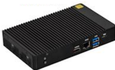
<NetDevancer Push GW>